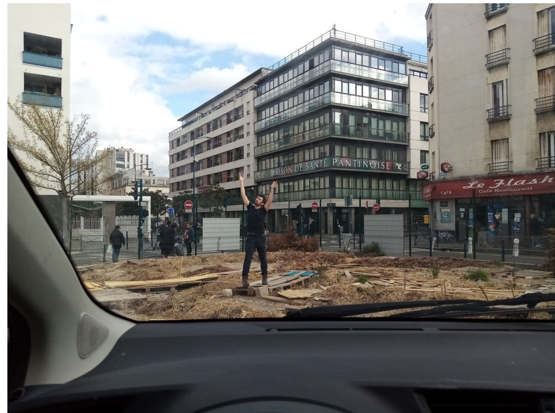
Paupière - Friche odysée - Pantin - 15/04/2021